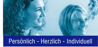
Persönlich - Herzlich - Individuell